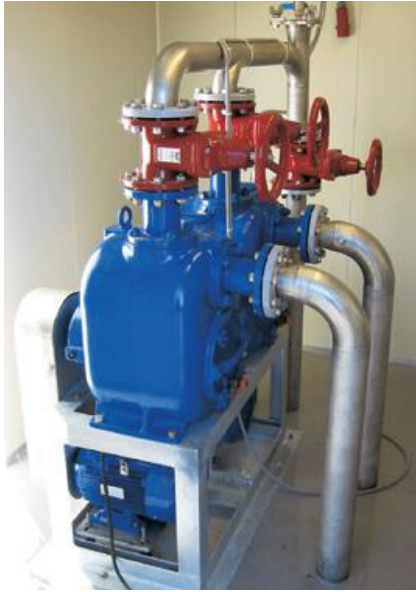
Maanpäällinen jäteveden pumppausasema