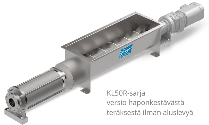
KL50R-sarja versio haponkestävästä teräksestä ilman aluslevyä