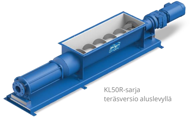
KL50R-sarja teräsversio aluslevyllä

KL-R-pumppuja on saatavana lukuisina eri malleina, jotka sopivat erilaisiin käyttöihin jäteveden- ja jätteenkäsittelystä maatalouteen ja teollisuuteen, tarpeen mukaan.