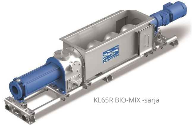
KL65R BIO-MIX -sarja

KL-R BIO-MIXin syöttökartiota on saatavana eri kokoisina ja kulutussuojalla. Huollettavuus on ilmiselvää muun muassa tarkastus- ja puhdistusaukkojen suuren koon ansiosta.